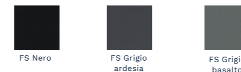
FS Nero FS Grigio ardesia FS Grigio basalto

L'intera gamma di colori è disponibile su www.vetrex.it