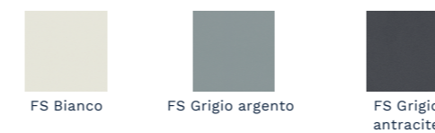
FS Bianco FS Grigio argento FS Grigio antracite