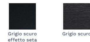
Grigio scuro effetto seta Grigio scuro